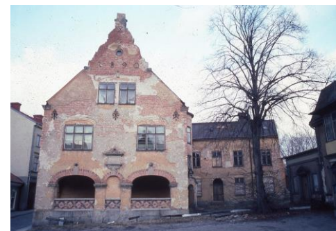
Åhlénska huset, ett fint exempel på renoveringsobjekt