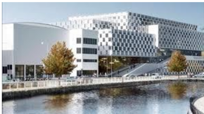
stilig byggnad där Mälardalens kunskap skall odlas

Guidad visning och kaffe efteråt i högskolans nya matsal. Det blir roligt att få se hur det ser ut även inne i byggnaden.