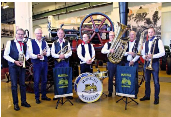
Denna sextett tycks ha sju medlemmar

Orkestern har funnits i mer än 20 år. De var hos oss 2013, så nu är det dags igen. De kommer att varva brunnsmusik och intressanta berättelser.