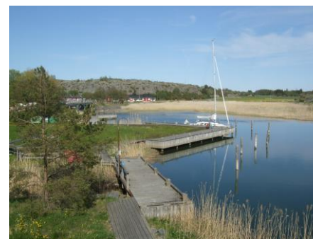
Utsikt från hotellet på Kökar.

Resan var uppskattad och visade på många intressanta sevärdheter. Vi gör nu resan igen. Hoppas på lika fint väder.